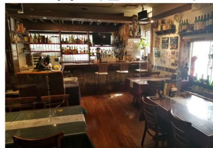
各テーブルの距離 密を避けれます