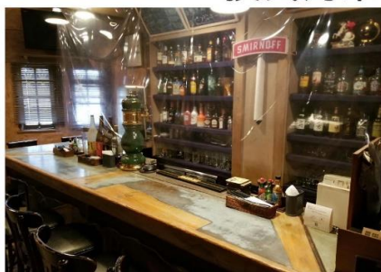
カウンターにはビニールシート設置