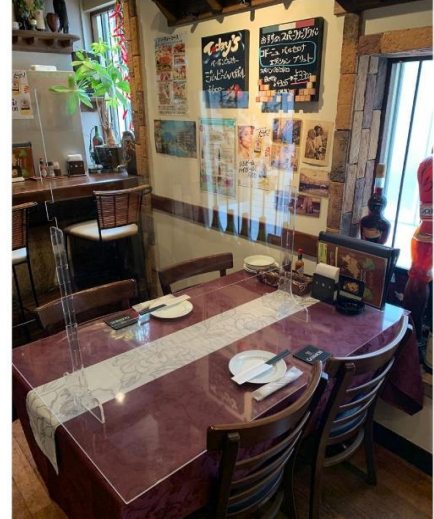
広いテーブル利用 密を避けれます