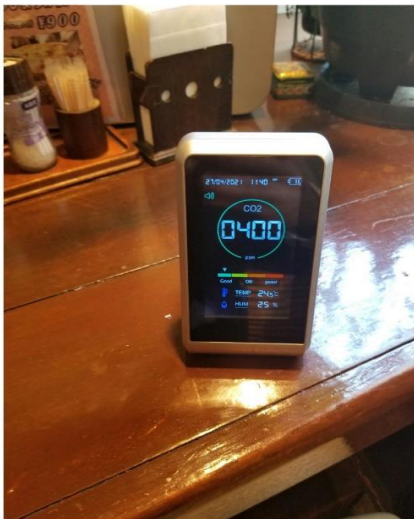
各フロアにCO2測定器設置