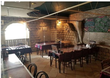
各テーブルの距離 密を避けれます