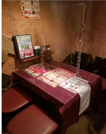
全てのテーブルにアクリル板設置