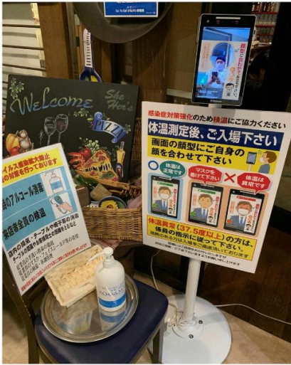
入り口に検温器とアルコール消毒液設置