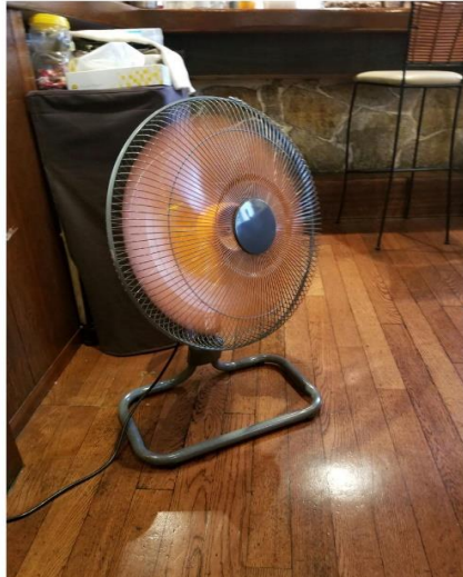
大型扇風機を使って換気対策